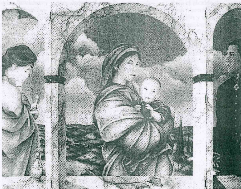
Uno de los cuadros que se exhibirán en Carmona durante la Bienal

Artistas de las tres religiones, expondrán juntos en una Bienal que les conduce desde Roma a la ciudad de Carmona. Ese camino pasa por Siena para hacer después un periplo por distintas ciudades de Andalucía: Écija, Montoro, Almodóvar del Río y Marchena.